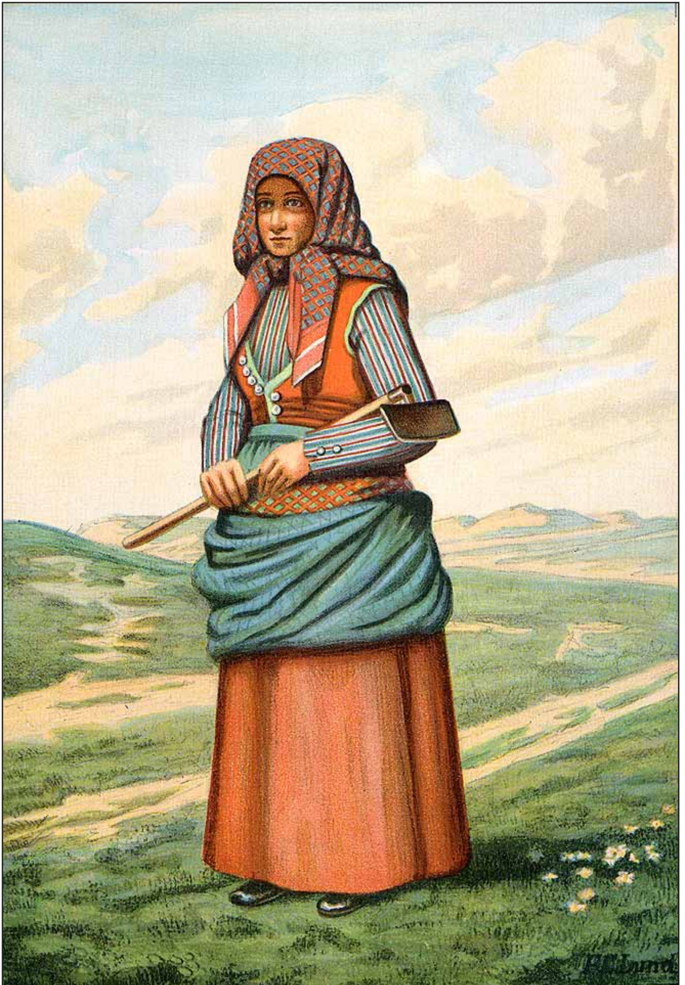
28. En Kone fra Rømø i Arbejdsdragt A married Woman from Rømø in Workingcostume