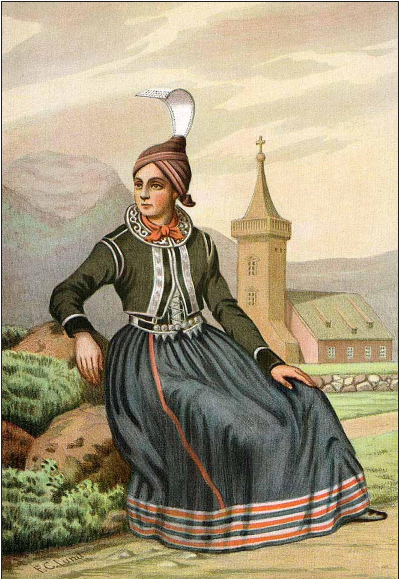
25. En Pige fra Mødruvellir