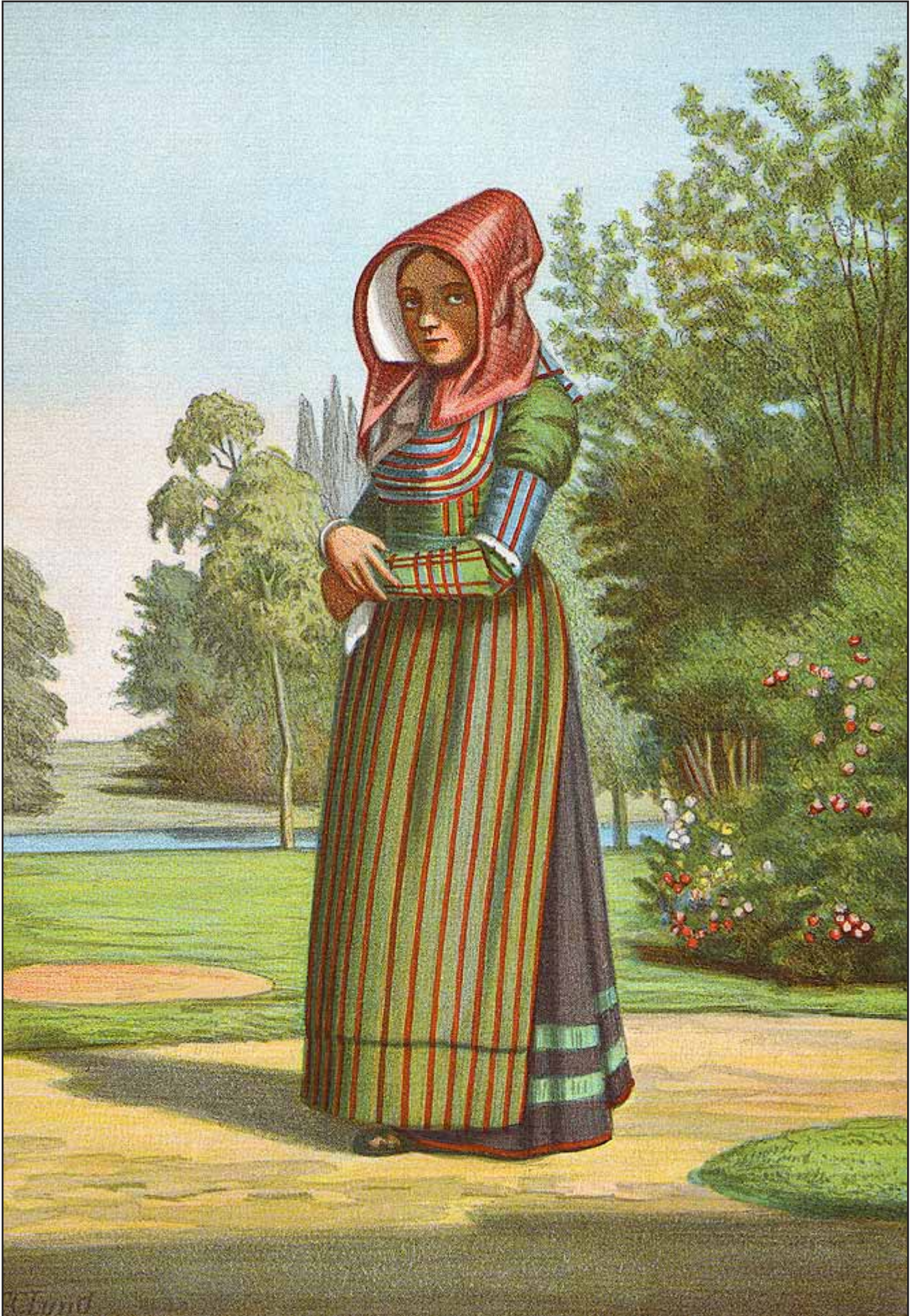
12. En Kone fra Falster