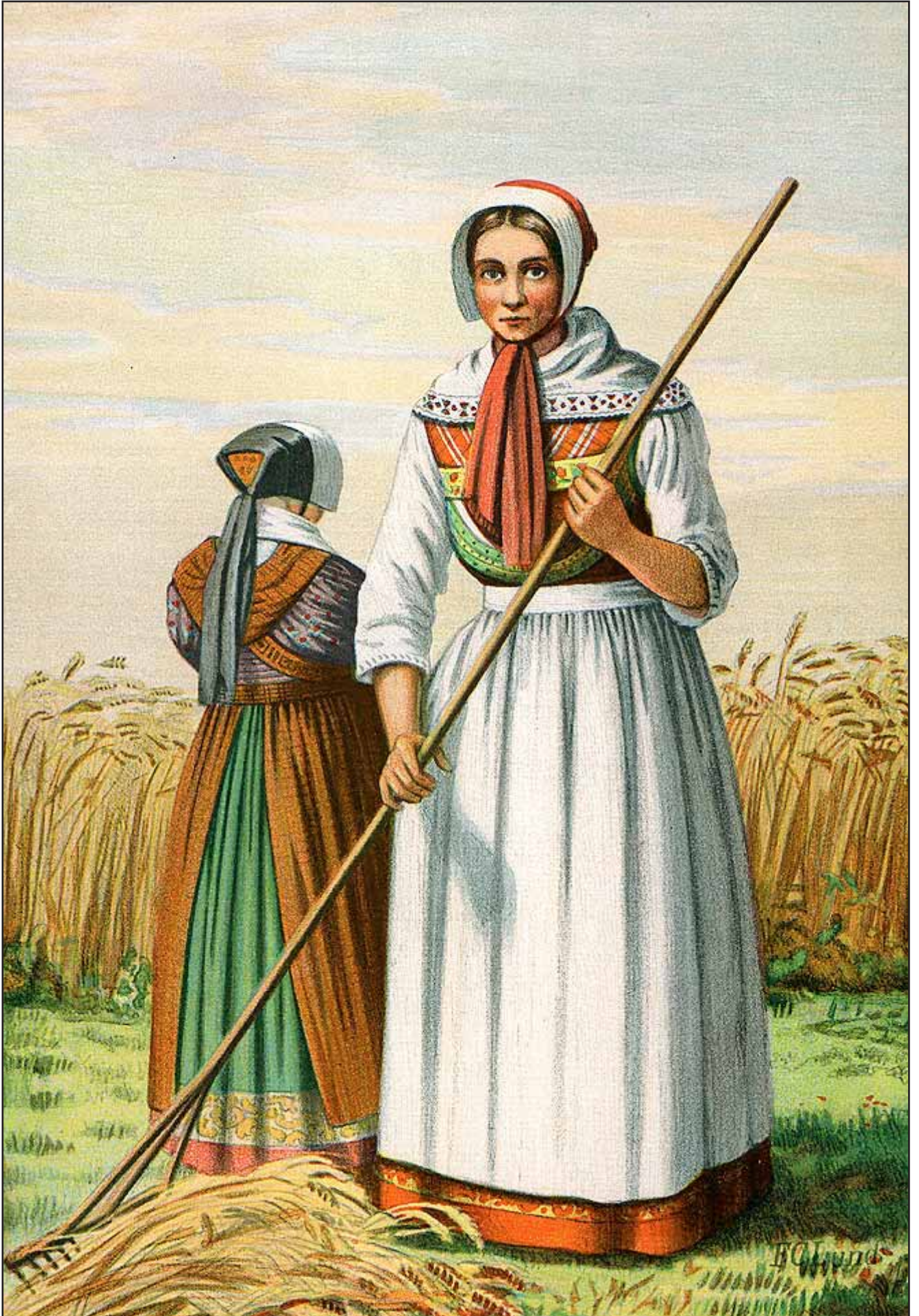
7. En Hedebo pige