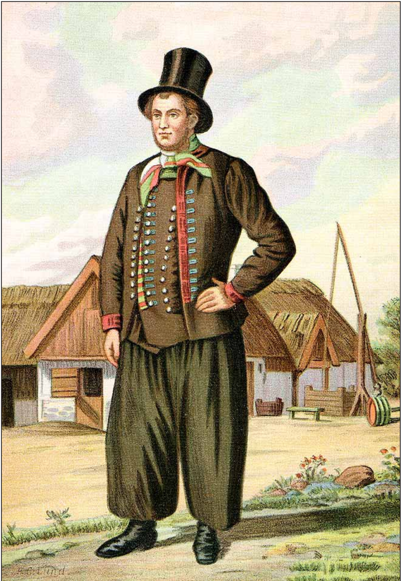
2. En Amager