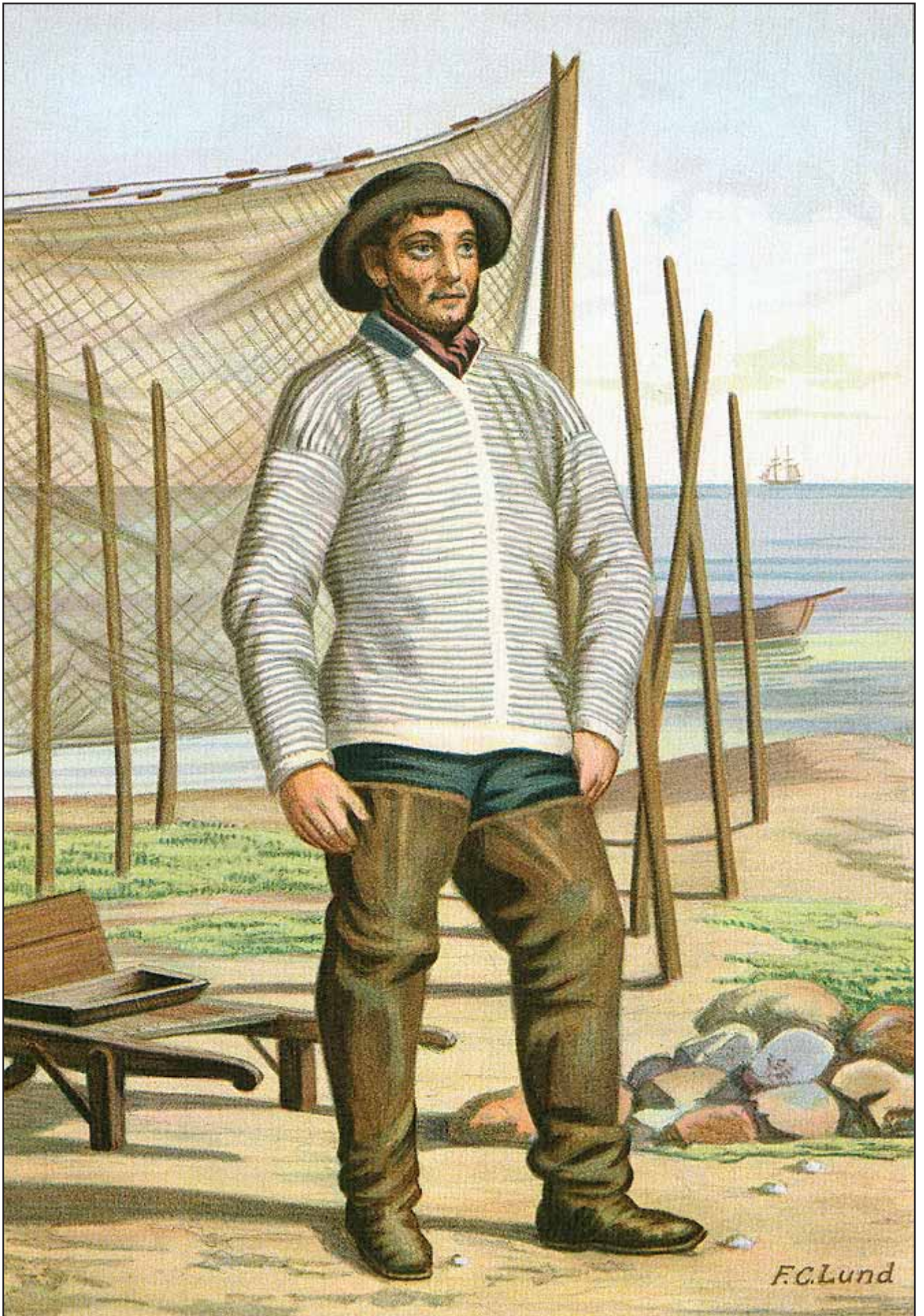
4. En Fisker fra Skovshoved