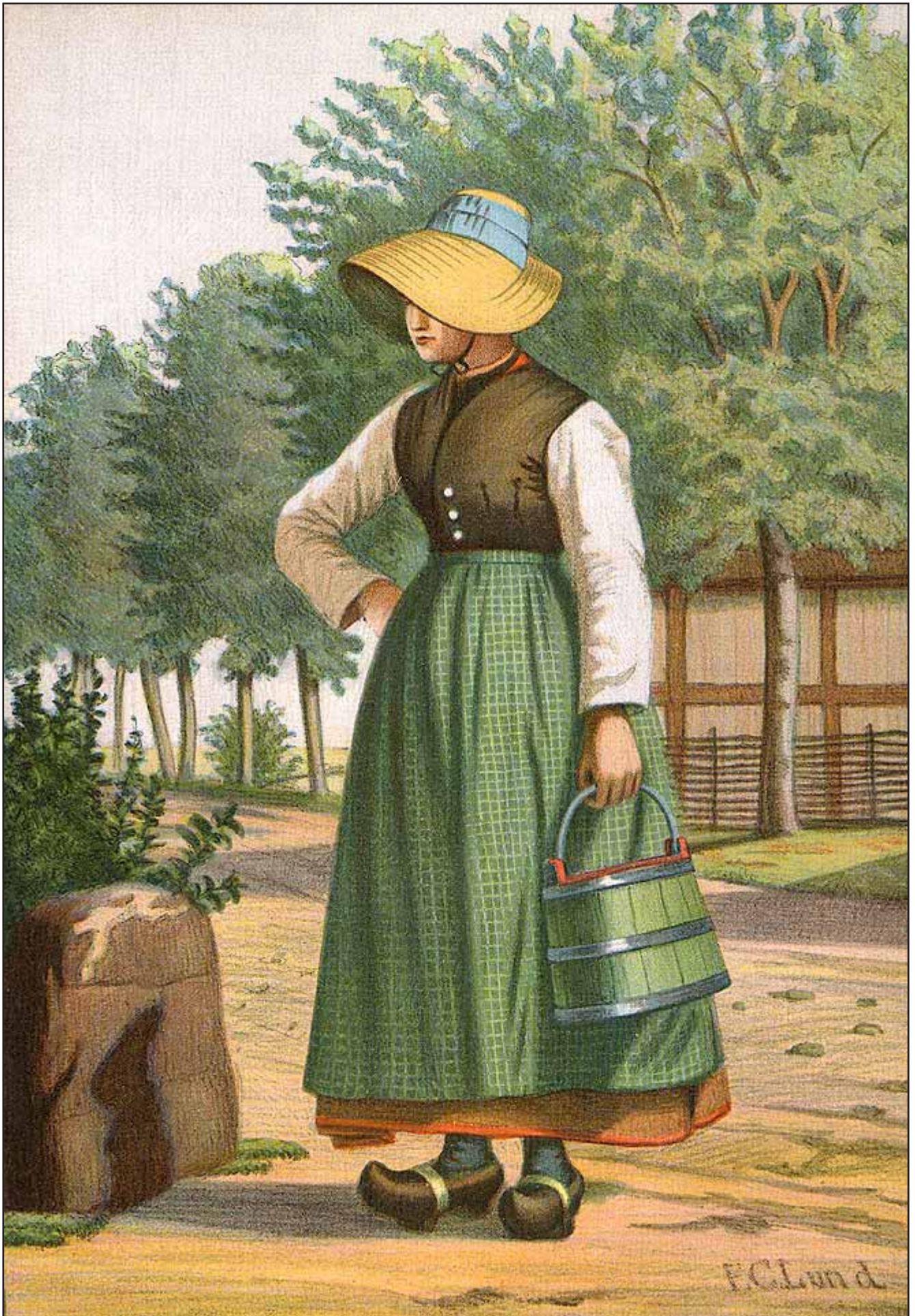
15. En Pige fra Ærø