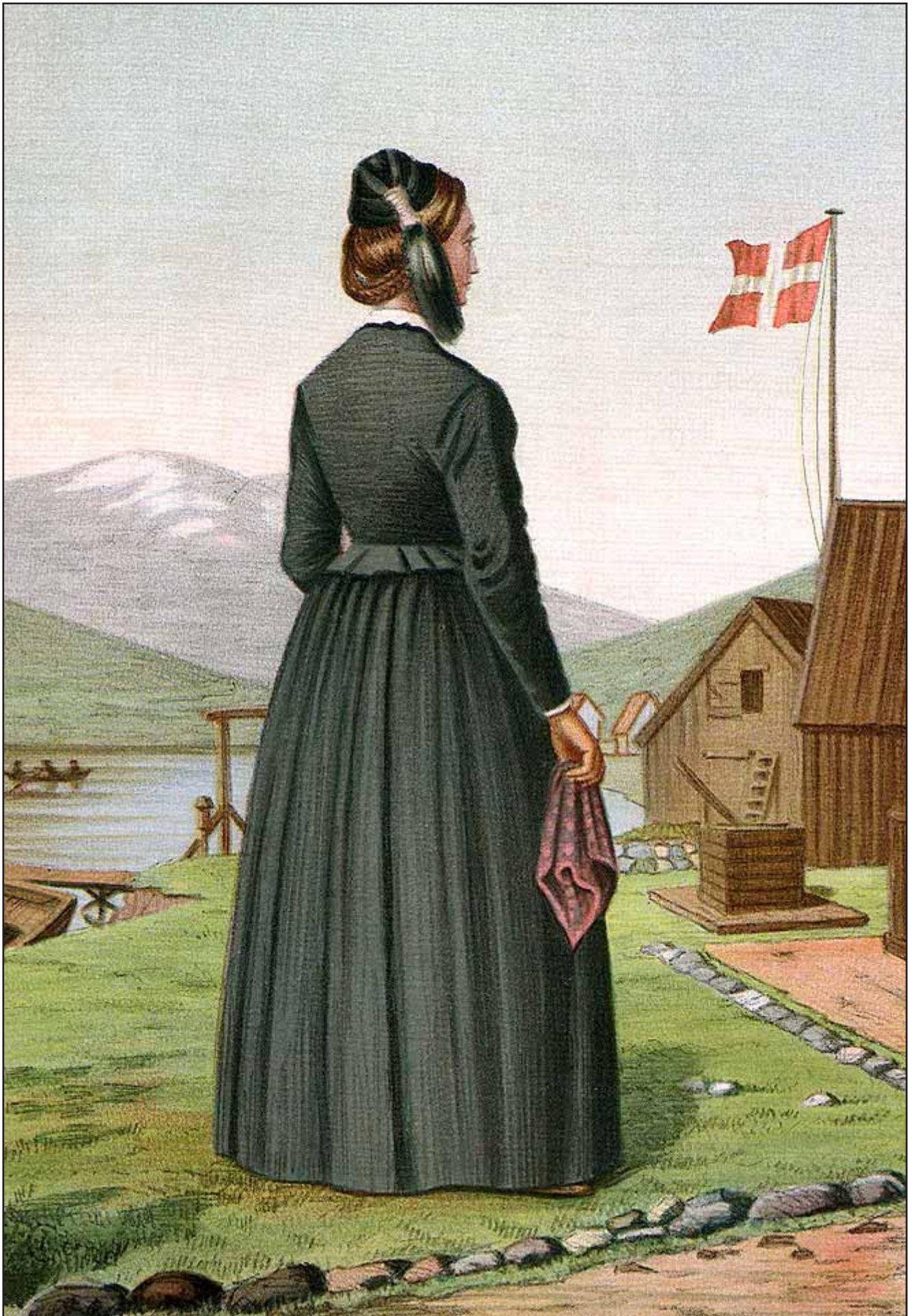
24. En Pige fra Øfjord