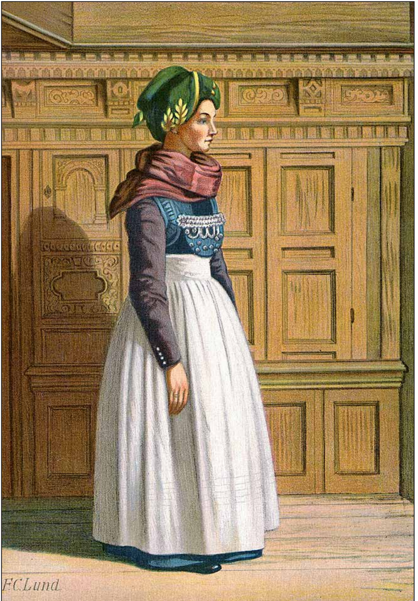
30. En Kone fra Amrum