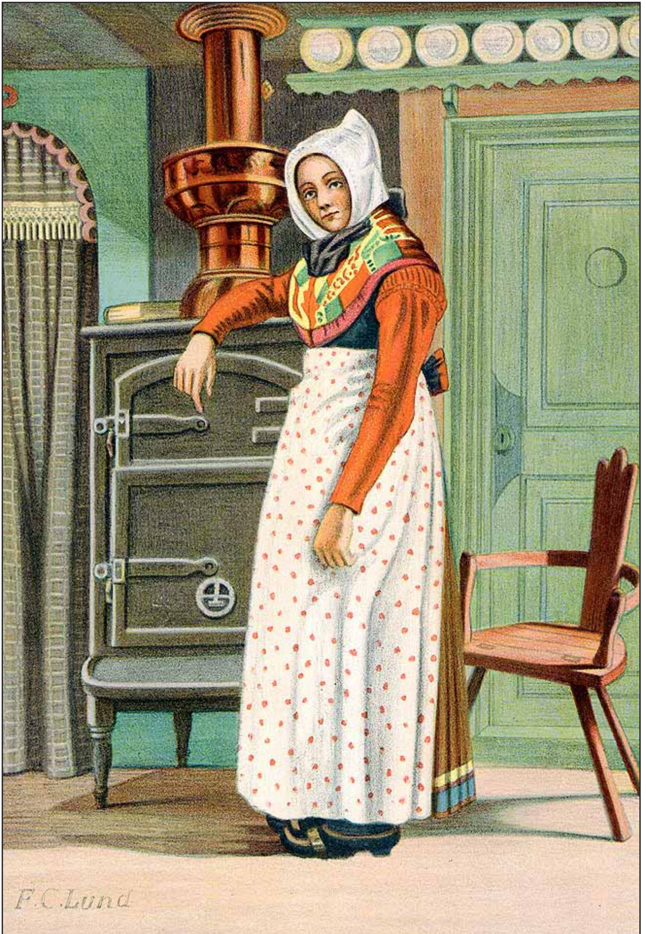
14. En Kone fra Drejø