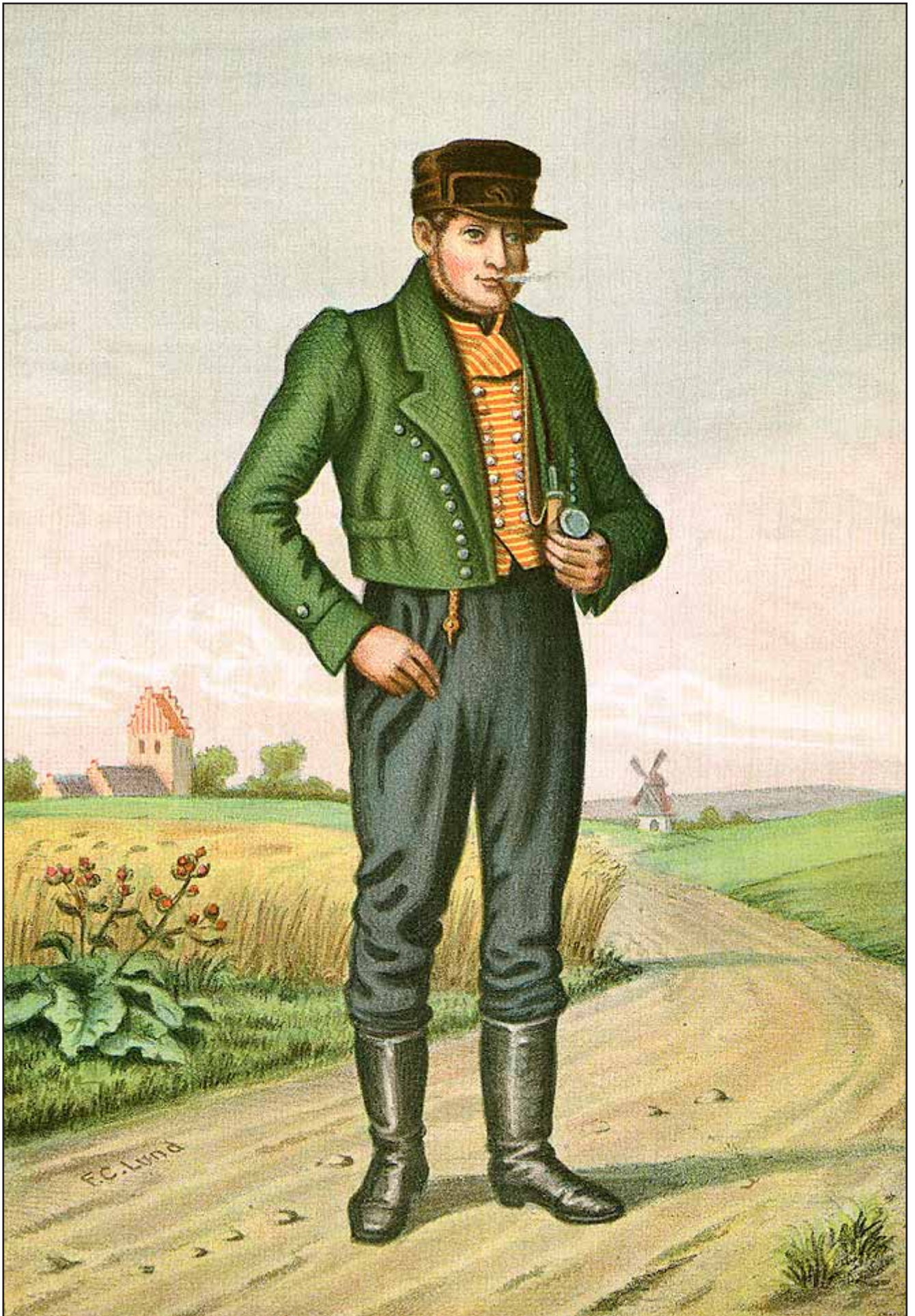
6. En sjællandsk Bonde