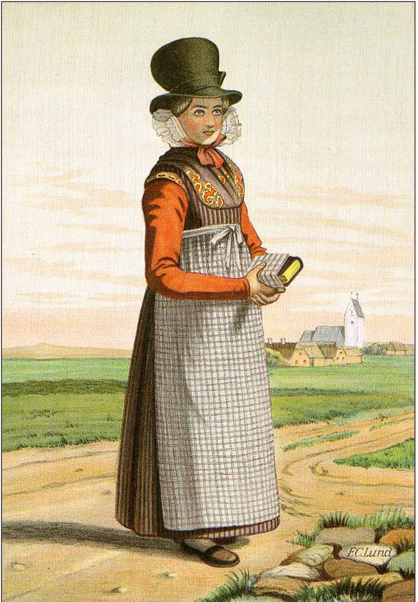
19. En Pige fra Ringkøbing-egnen