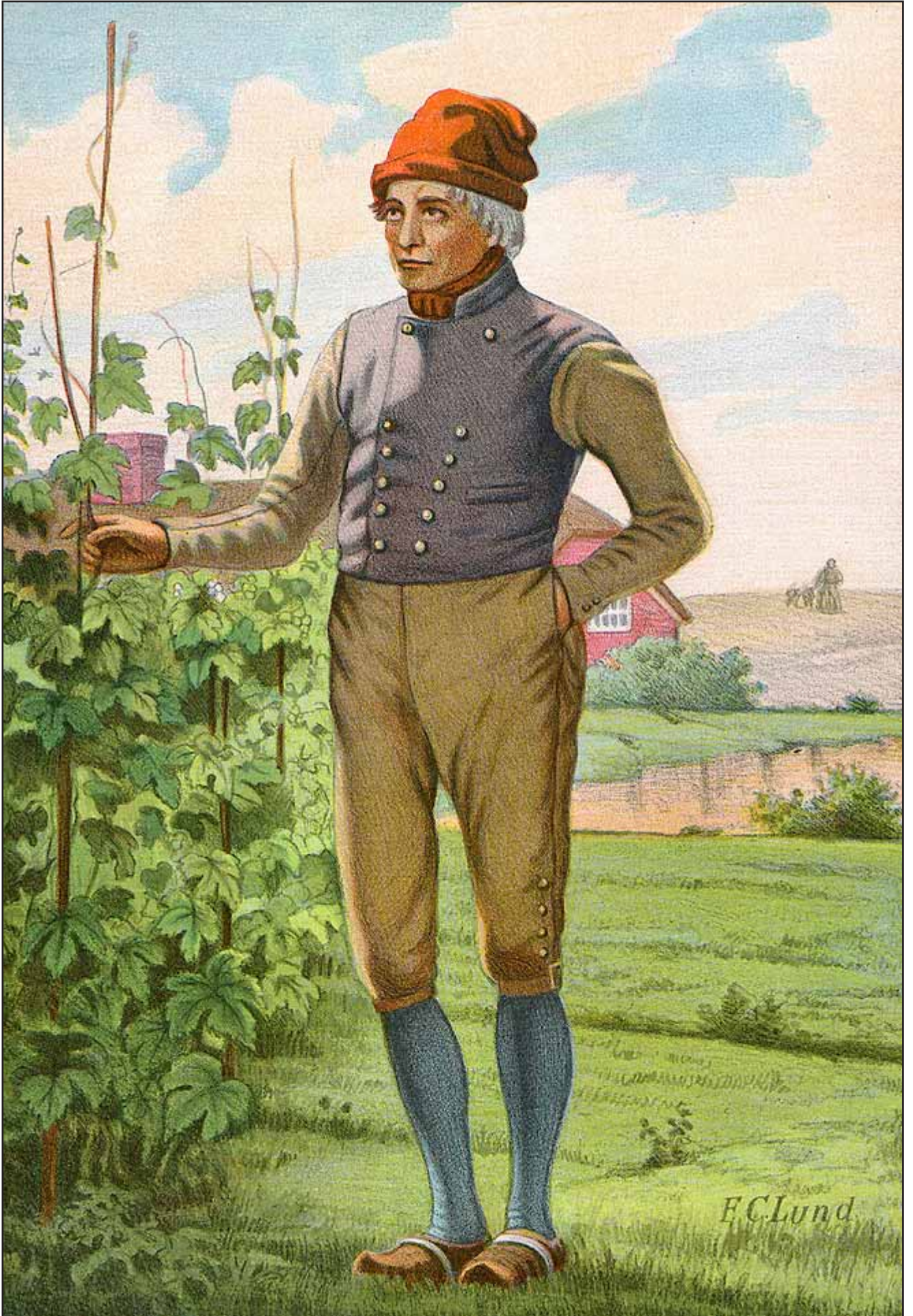
18. En Bonde fra Mors