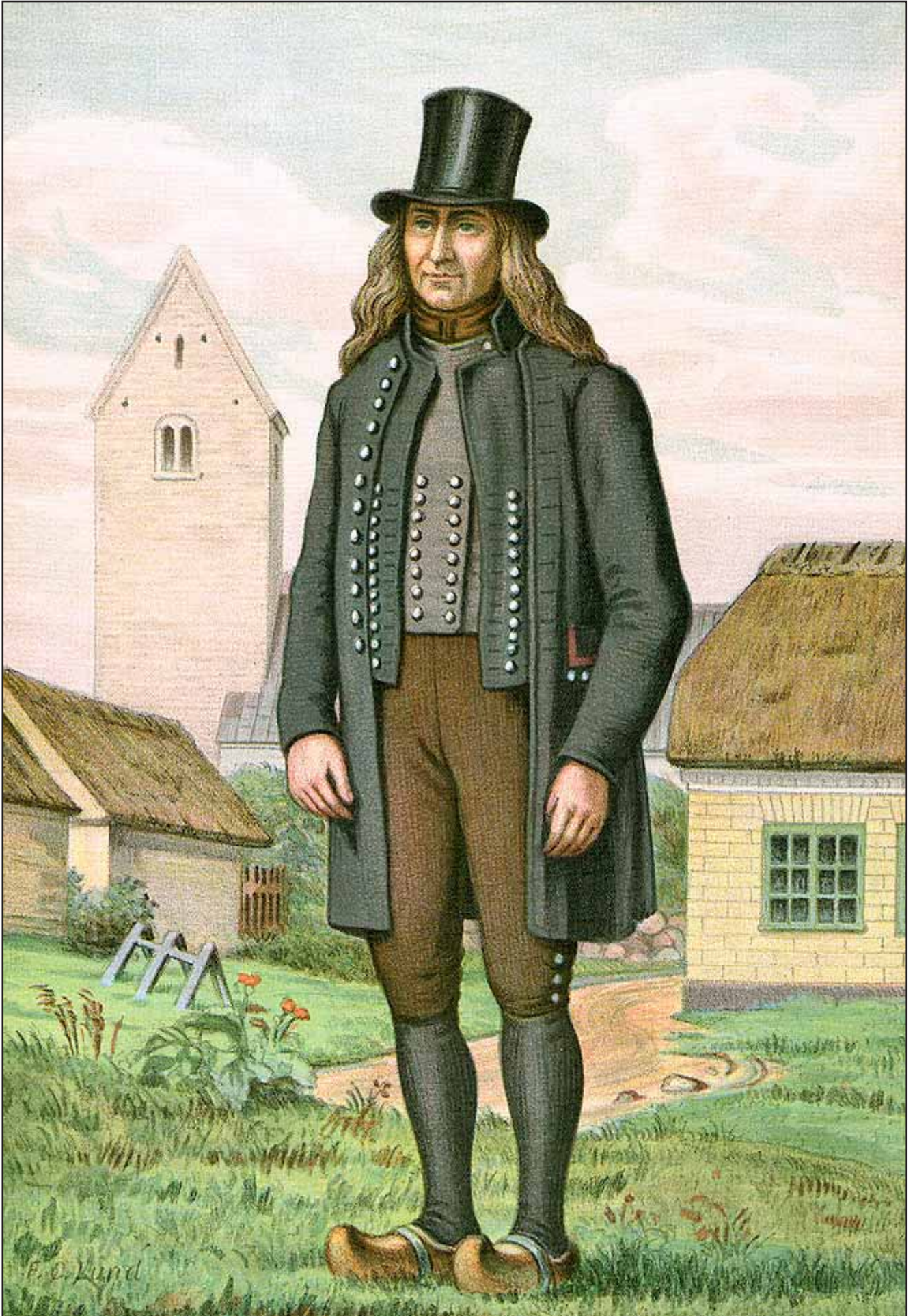
16. En Mand fra Fur