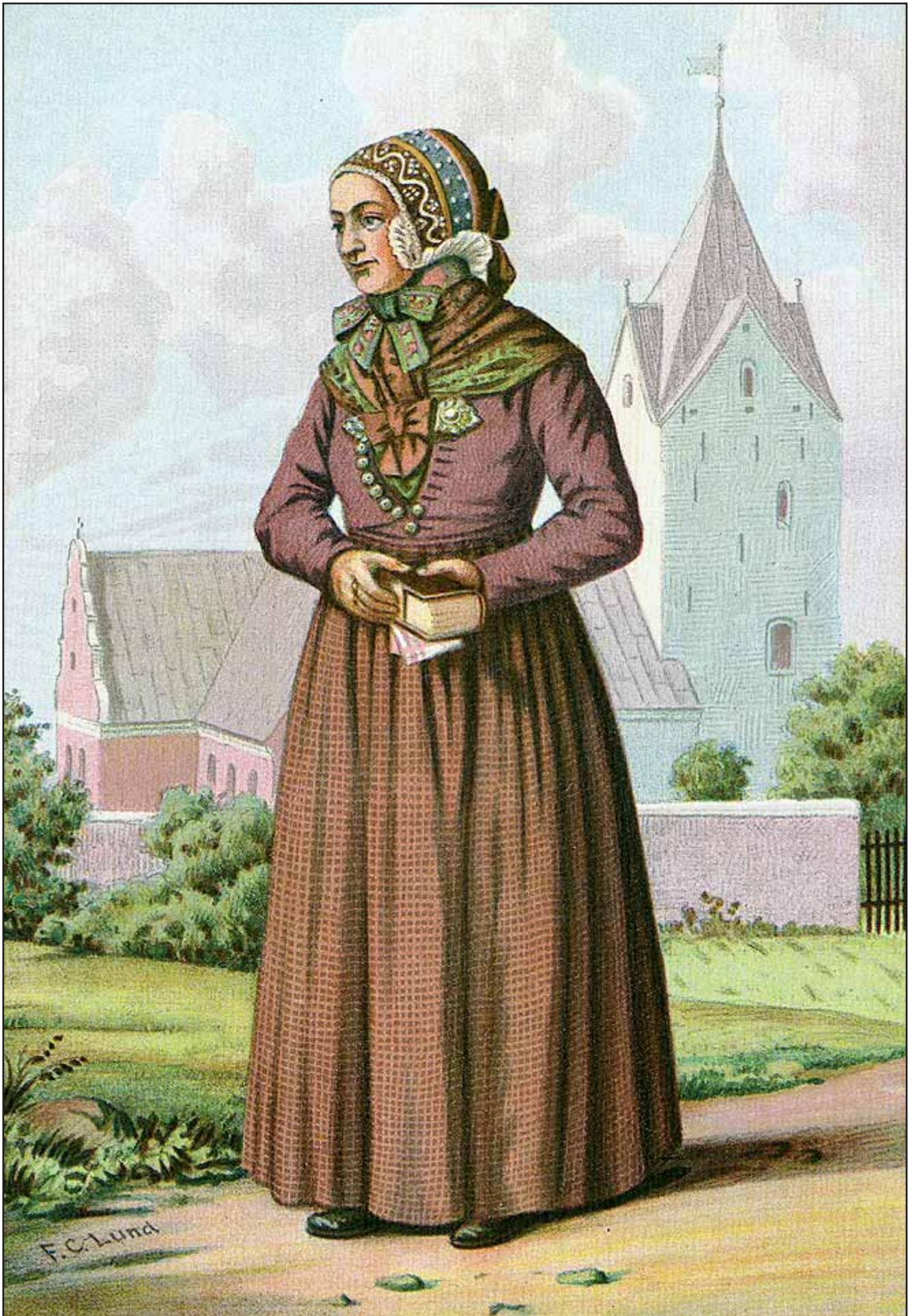
27. En Kone fra Rømø