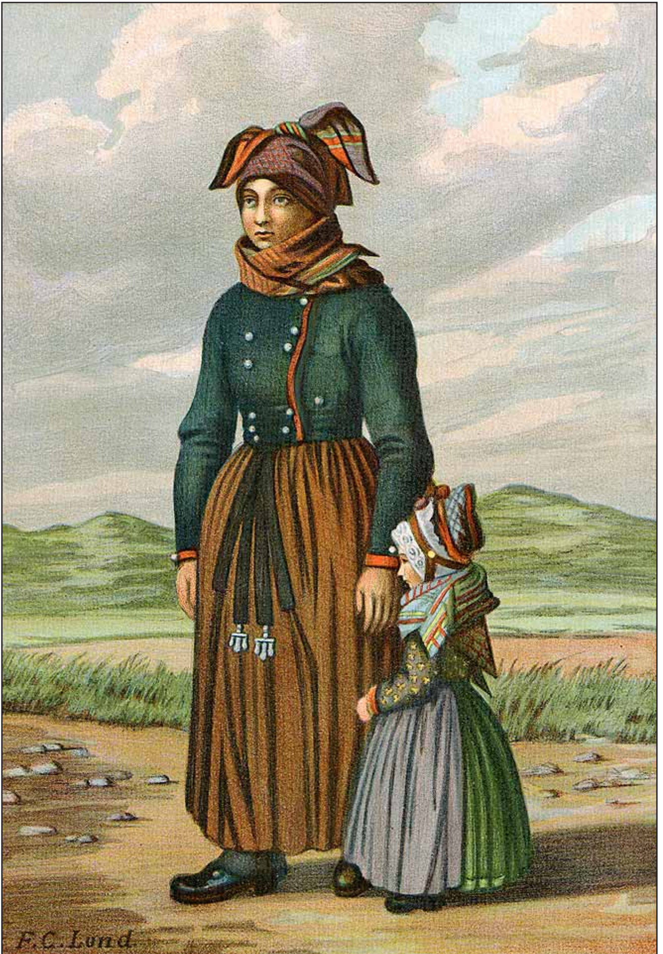
23. En Kone fra Fano