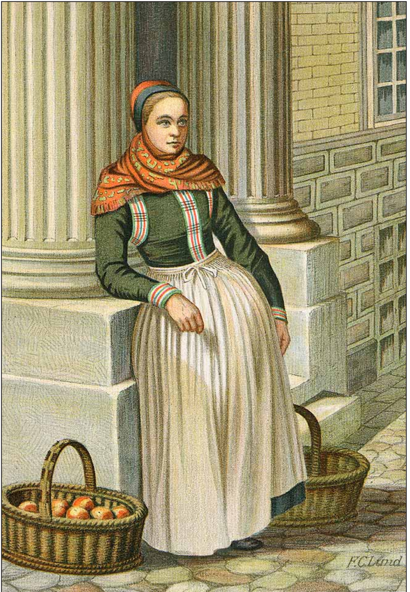
3. En Amagerpige