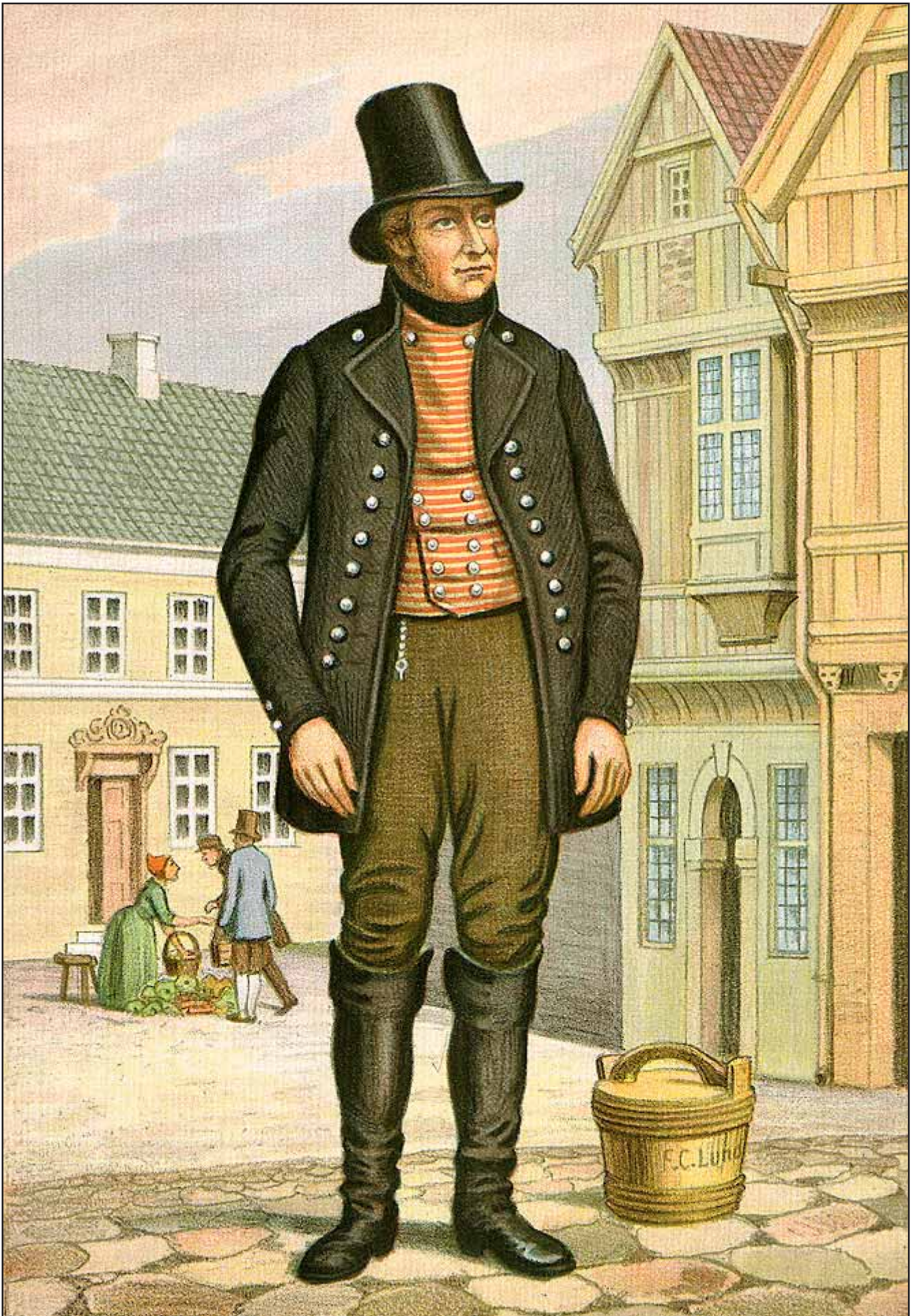
21. En Bonde fra Randers-egnen