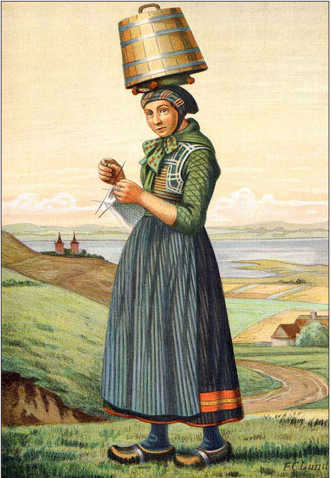
9. En Pige fra Røsnæs