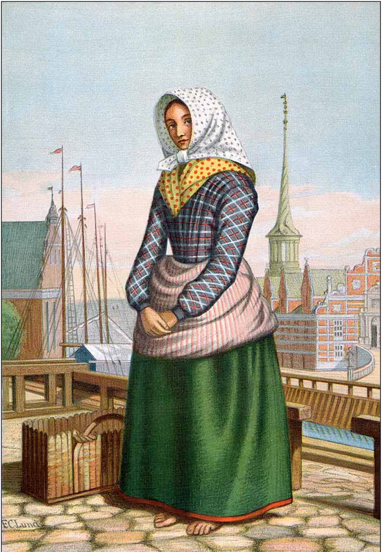
5. En Skovshovedpige