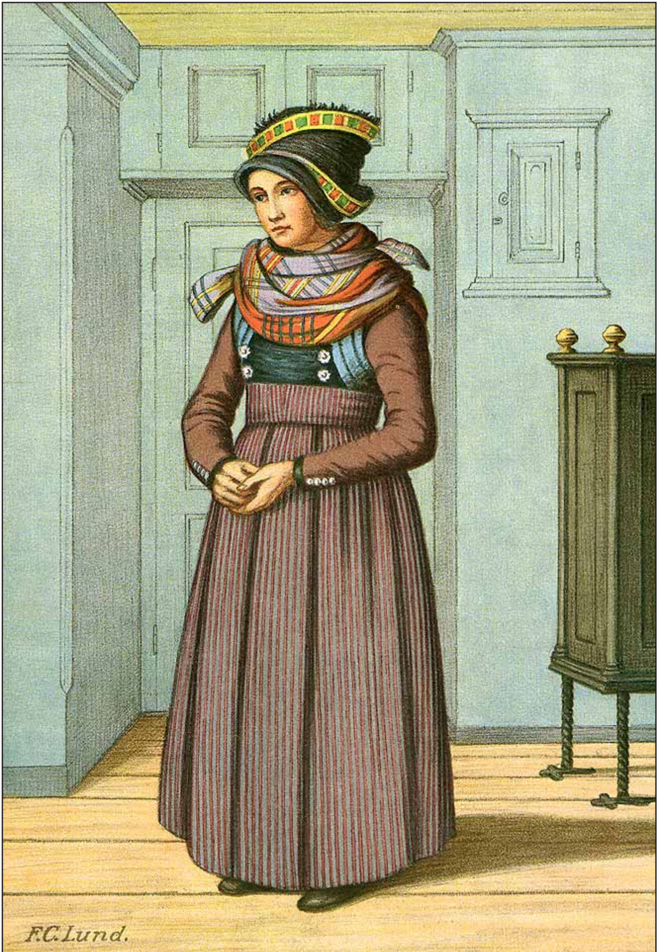
29. En Pige fra Føhr