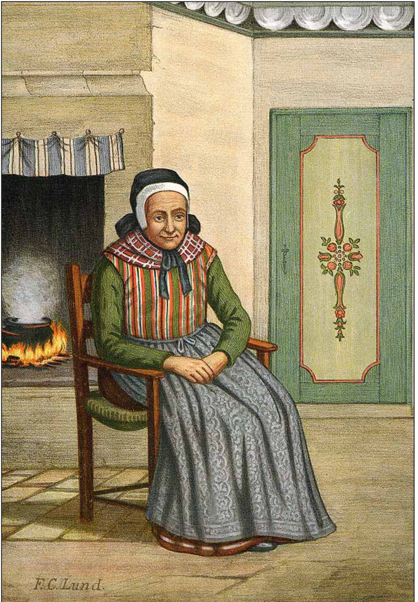
13. En Kone fra Avernakø