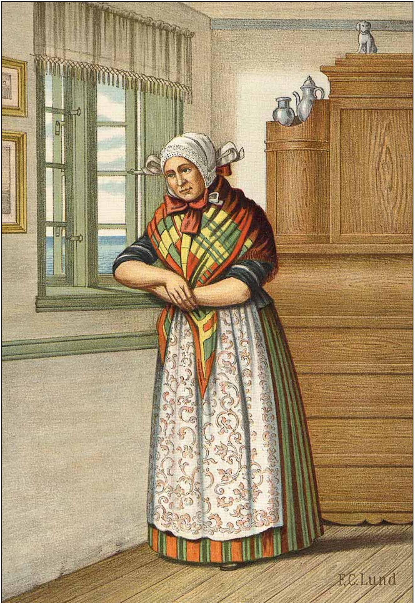
10. En Kone fra Bornholm