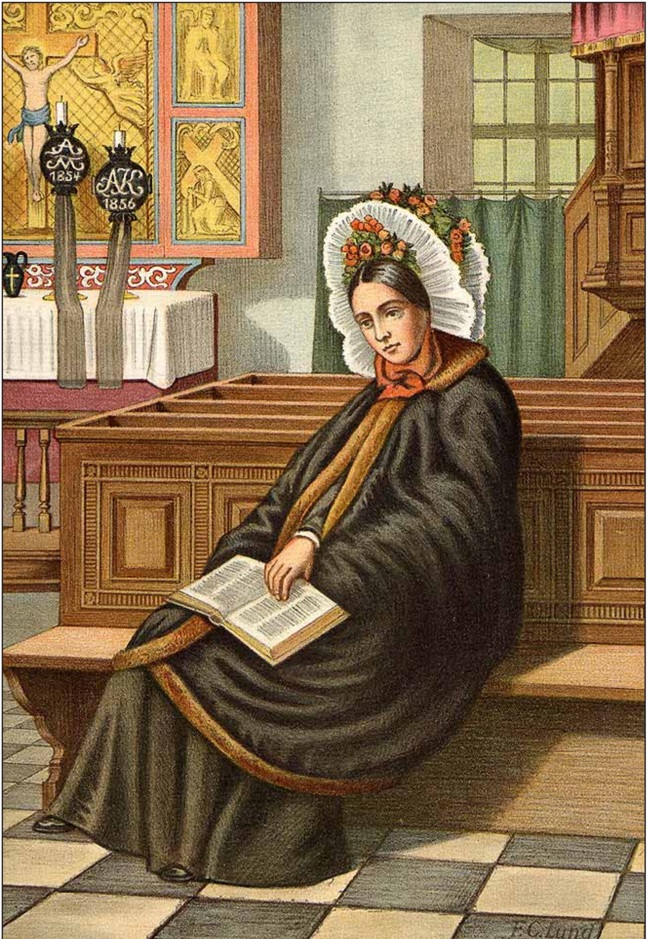
11. En Kirkedragt fra Bornholm