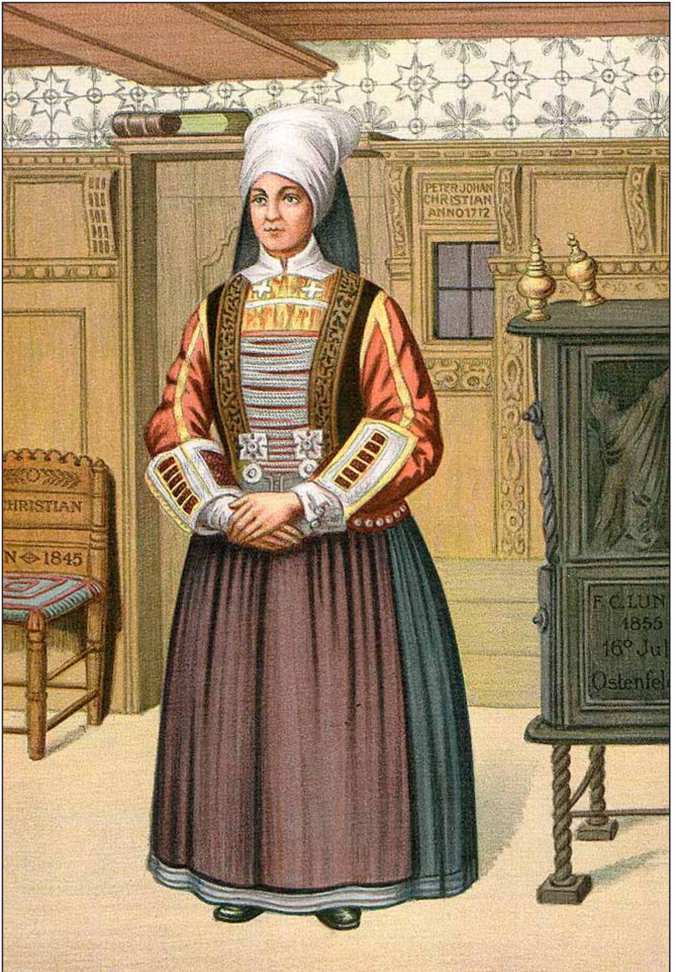
31. En Kone fra Ostenfeld