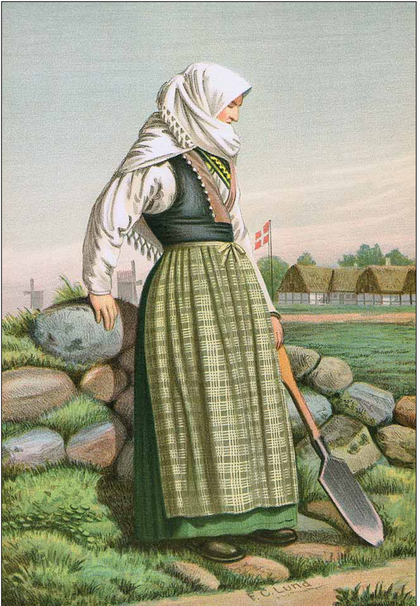
22. En Pige fra Læsø