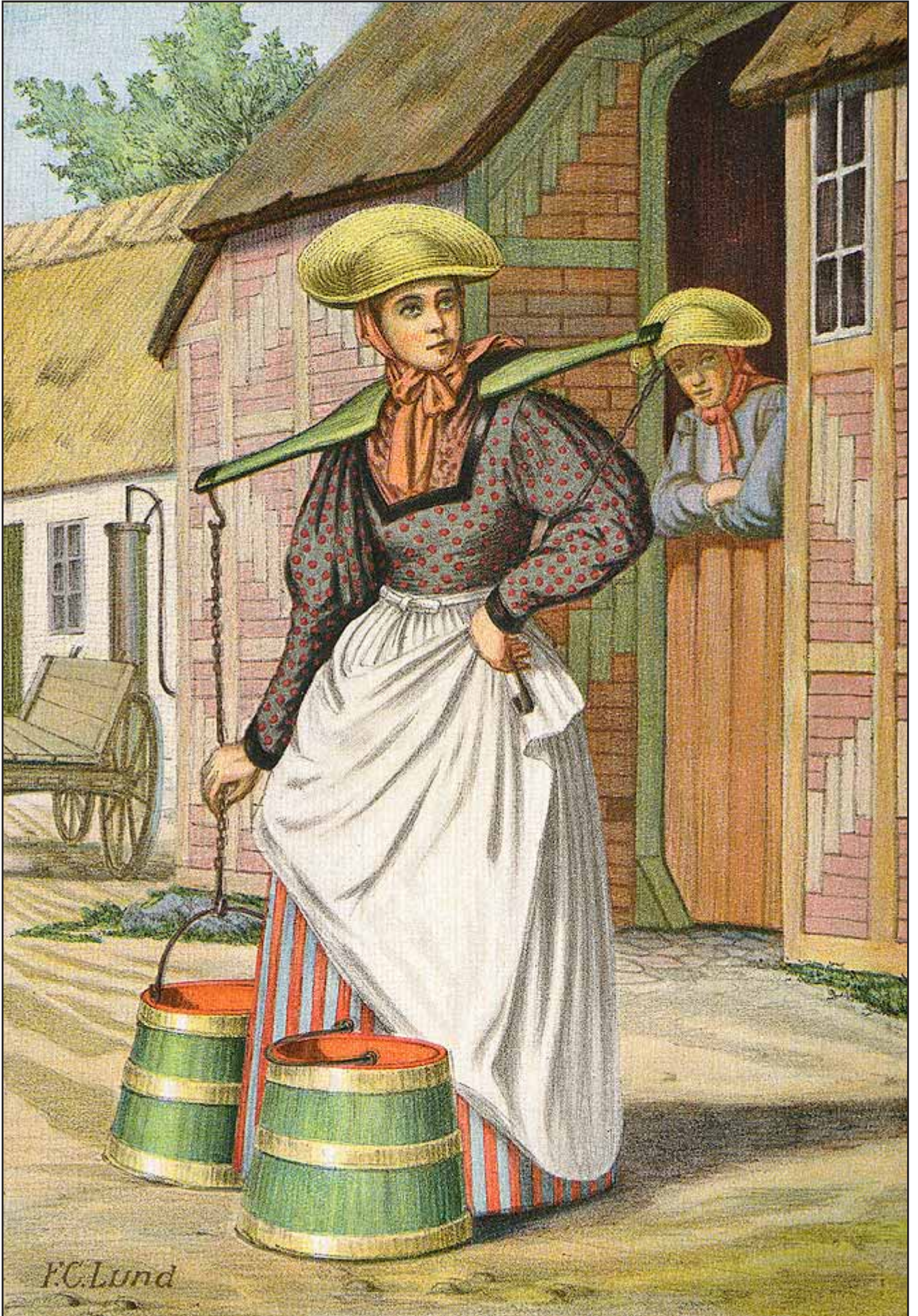
26. En Pige fra Dannevirke